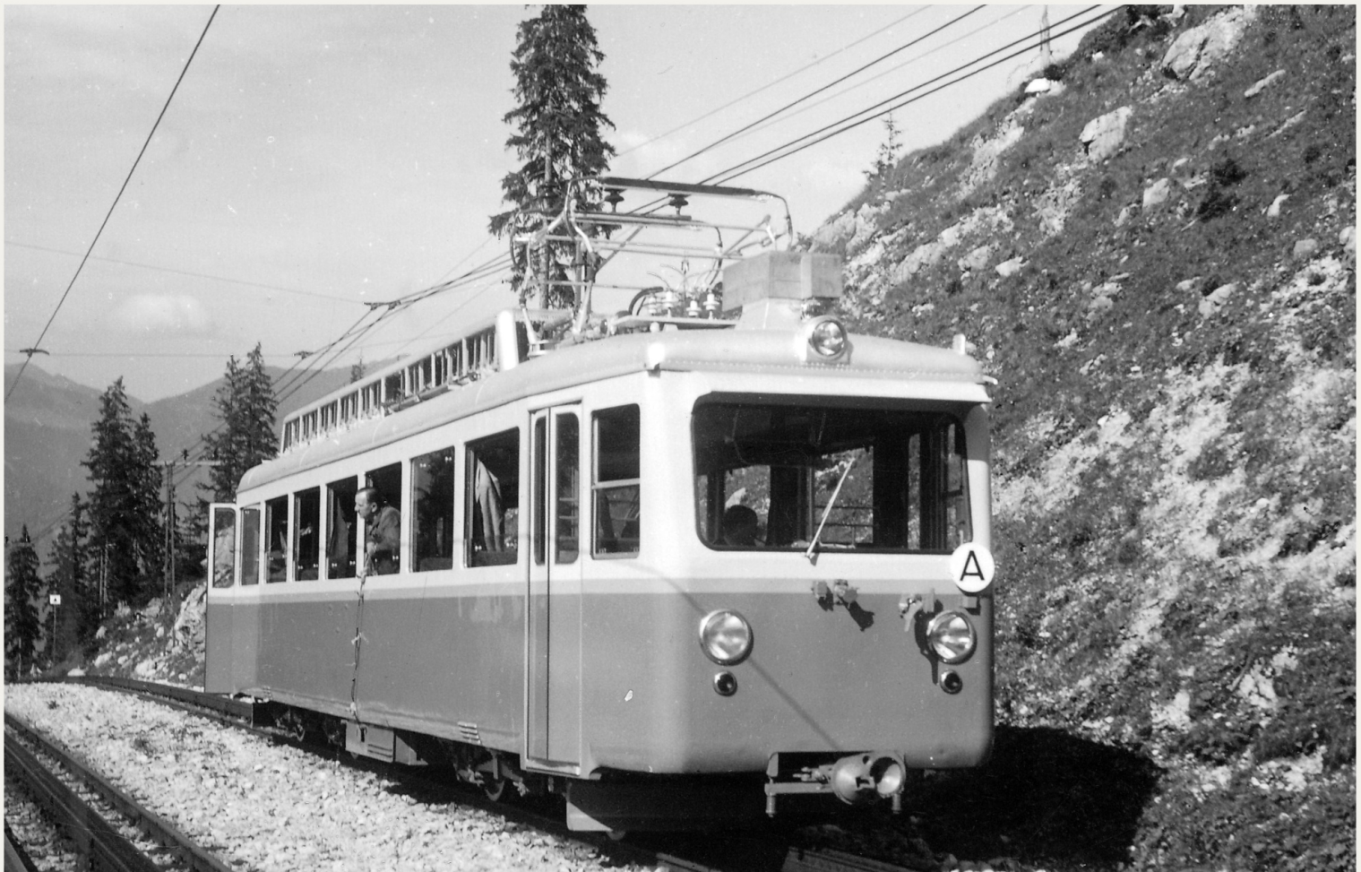
Alle Rechte vorbehalten. Gedruckt in Deutschland.

ZEITGEIST-Models ist eine Marke der manufactive UG | Uhlenburgstraße 20 | 32760 Detmold www.ZEITGEIST-Models.eu