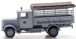
316.094 Hansa Lloyd Merkur