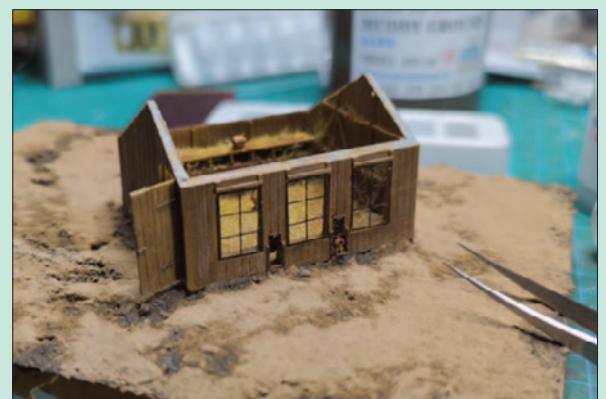
Auch das Stallgebäude wird anmodelliert und die noch feuchte Paste sofort mit Parabraunerde von Minitec abgestreut.