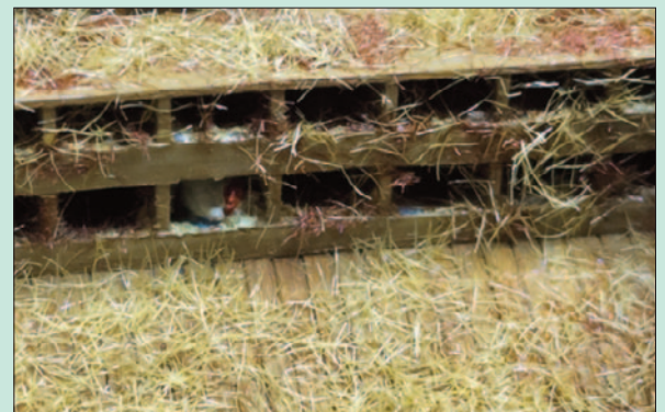
Details des ebenfalls mit Stroh ausgelegten Regals mit den Nestern. In einem davon ist gerade ein Huhn dabei, ein Ei zu legen.

Als Basis des Dioramas dient eine 17 cm x 12 cm große Styrodurplatte. Diese wird mit hellbrauner Acrylfarbe grundiert. Im nächsten Schritt wird der Hühnerstall so auf der Grundplat-