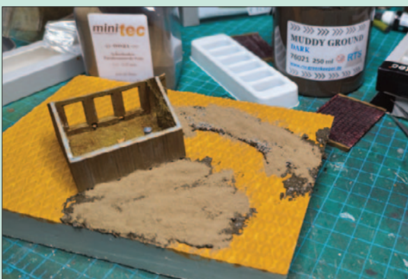
Die Landschaft und der Weg zum Stall werden mit Strukturpaste von RTS modelliert.

Da nur lichter Graswuchs nachgebildet werden soll, wird in den Be-