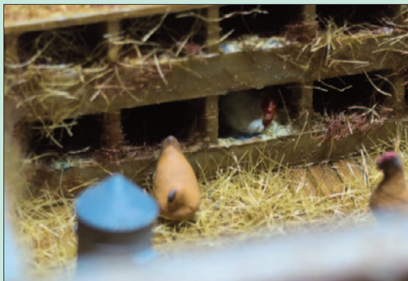
Das weiße Huhn schaut aus dem Nest, braune Hühner sind im Stall unterwegs.

Durch die filigranen Luken aus Messing gelangen die Hühner aus oder in den Stall. Eben macht sich ein Huhn auf den Weg ins Freie.